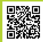
子どもアートLab よくある質問（FAQ）