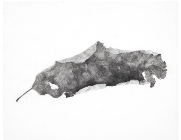
《dry leaves 1》2018 pencil on paper

March 2021 3/6 SAT. — 28 SUN. OPEN 10:00 — 18:50 会期中無休 観覧無料