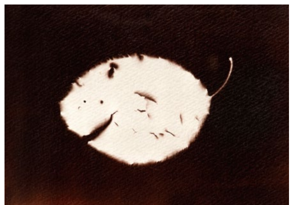
《fallen leaves》2021 albumen print