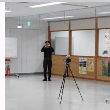
昨年度の企画 「目が合った人の真似をする」

日時 11.1[日]ー28[土]の金土日・祝 [金]13:00-19:00 [土日・祝]10:00-17:00