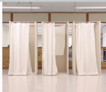
昨年度の企画 「秋田から始まるファッション〜個人ブティックを訪ねて〜」

日時 11.1[日]ー28[土]の金土日・祝 [金]13:00-19:00 [土日・祝]10:00-17:00